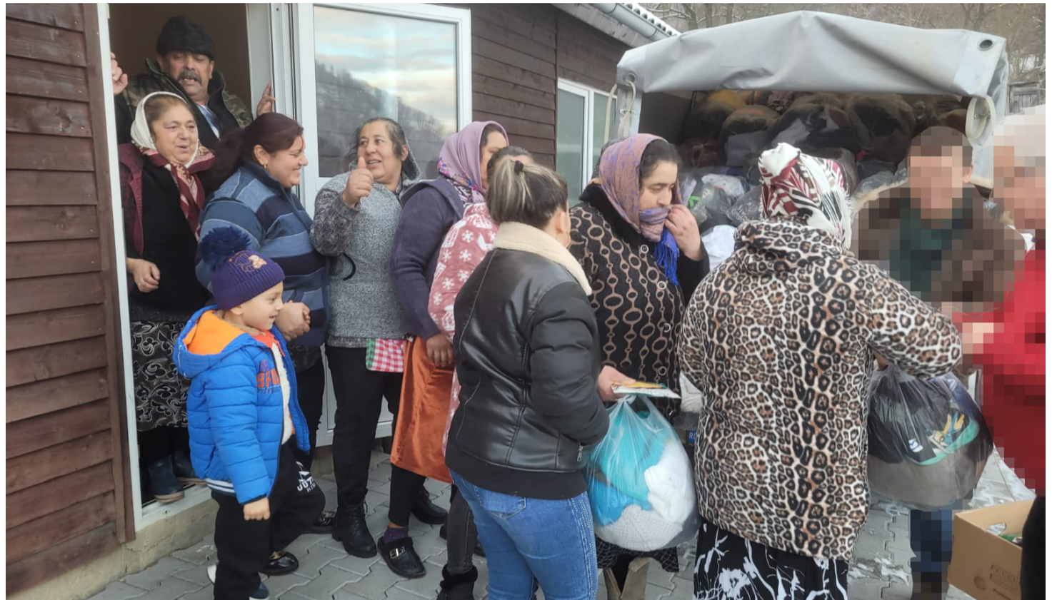
Verteilung von Hilfsgütern, die der Verein Humanitäre Nothilfe Ukraine organisiert hat.